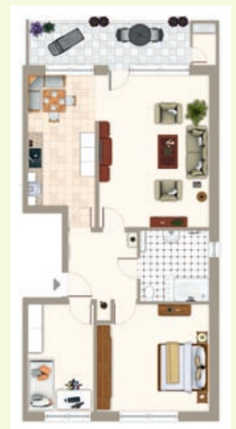
Exposéaufbereitung: vorher und nachher